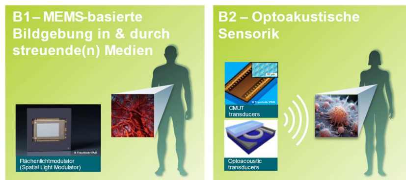
Abbildung 2: Die zwei Leitprojekte (B1, B2) des Clusters B

Im Cluster „ Hochauflösende optische Verfahren für die Biowissenschaften “ werden zukünftig zu erwartende Bedarfe bezüglich der Erkennung und Charakterisierung von Objekten in den Feldern Biologie, Biotechnologie, Medizin, Medizintechnik und Gesundheitswissenschaften adressiert.