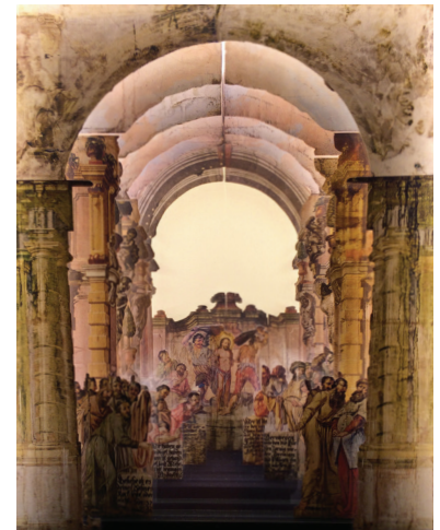
Modell des Bühnenbildes „Palasthof“, Geißelung Jesu.

Das von dem böhmischen Maler Seyfried geschaffene Neuzeller Kulissentheater verwendet bemalte Leinwände auf Keilrahmen und bemalte Holztafeln als Bühnendekoration. Die fast lebensgroßen Figuren und Figurengruppen sind ebenfalls mit Leimfarben auf Holztafeln aufgemalt. Diese Holztafeln stellte man in die aus sechs Ebenen bestehende Kulissengasse, die mit einem über sechs Meter hohen Proszenium eingeleitet und mit einem Schlussbild abgeschlossen wird. Die perspektivische Wirkung wird dadurch erzeugt, dass der etwa sechs Meter tiefe Theaterboden