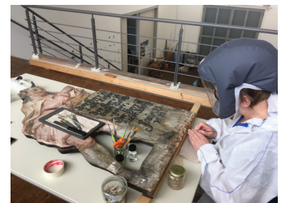
Restauratorin bei der Arbeit in Schutzkleidung.

Wesentliches Ziel des Konservierungskonzeptes ist es, den weiteren Verfall des Ensembles mit möglichst minimalen Eingriffen in die originale Substanz aufzuhalten. Alle konservatorischen Bemühungen beruhen darauf, den weitgehend „unberührten“ Zustand mit seinem unverfälscht überlieferten Charakter soweit wie möglich zu bewahren. Von provisorischen Stabilisierungs-Maßnahmen an den Spannrahmen und Aufspannungen sowie einer rückseitigen Holzschutzmittel-Imprägnierung abgesehen, war in den vergangenen Jahrhunderten keine umfassende restauratorische Bearbeitung vorgenommen worden. Über den reinen Substanzerhalt hinaus macht die Konservierung ein Aufstellen des Bühnenbildes möglich und auf diese Weise das Passionstheater als Bühnenapparat wieder erlebbar. Daher müssen alle Bildträger und Malschichtflächen ausreichend konsolidiert werden, um zukünftige Transporte und Montagen verlustfrei durchführen zu können. Zudem gilt es, die einzelnen Teile des Bühnenbildes und der Szene als Gesamtkunstwerk möglichst in einen einheitlichen Zustand zu versetzen.