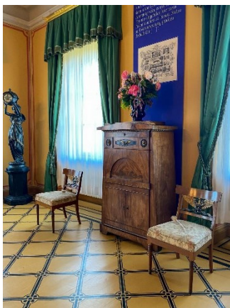
Lucies Pyramidensekretär