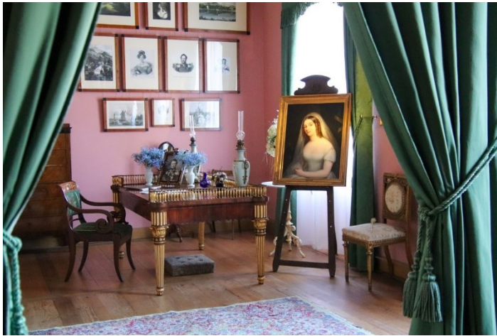
Blick in die Große Saalstube im Schloss Branitz – Zimmer der Fürstin