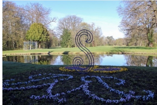
Kronenbeet mit Schnucke S im