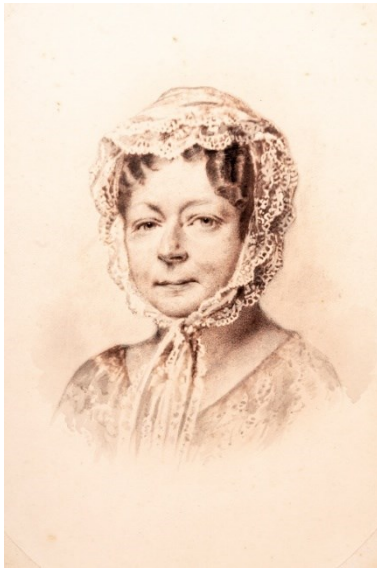
Altersbildnis der Fürstin, um 1850

Fotos zum Download: 09-04-2026 FRAUENREICH Branitz