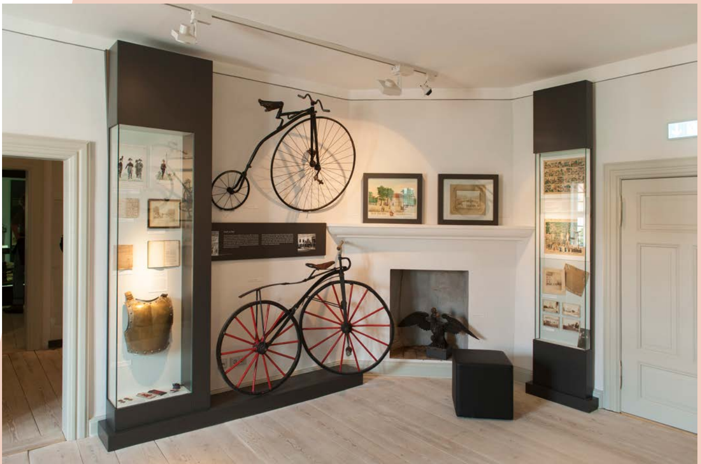
Ausstellungsraum im Wegemuseum Wusterhausen/Dosse.