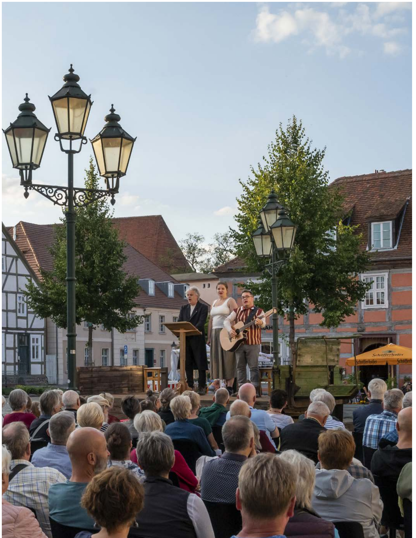
Sommertheater im historischen Stadtkern von Angermünde