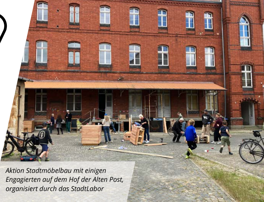
Aktion Stadtmöbelbau mit einigen Engagierten auf dem Hof der Alten Post, organisiert durch das StadtLabor