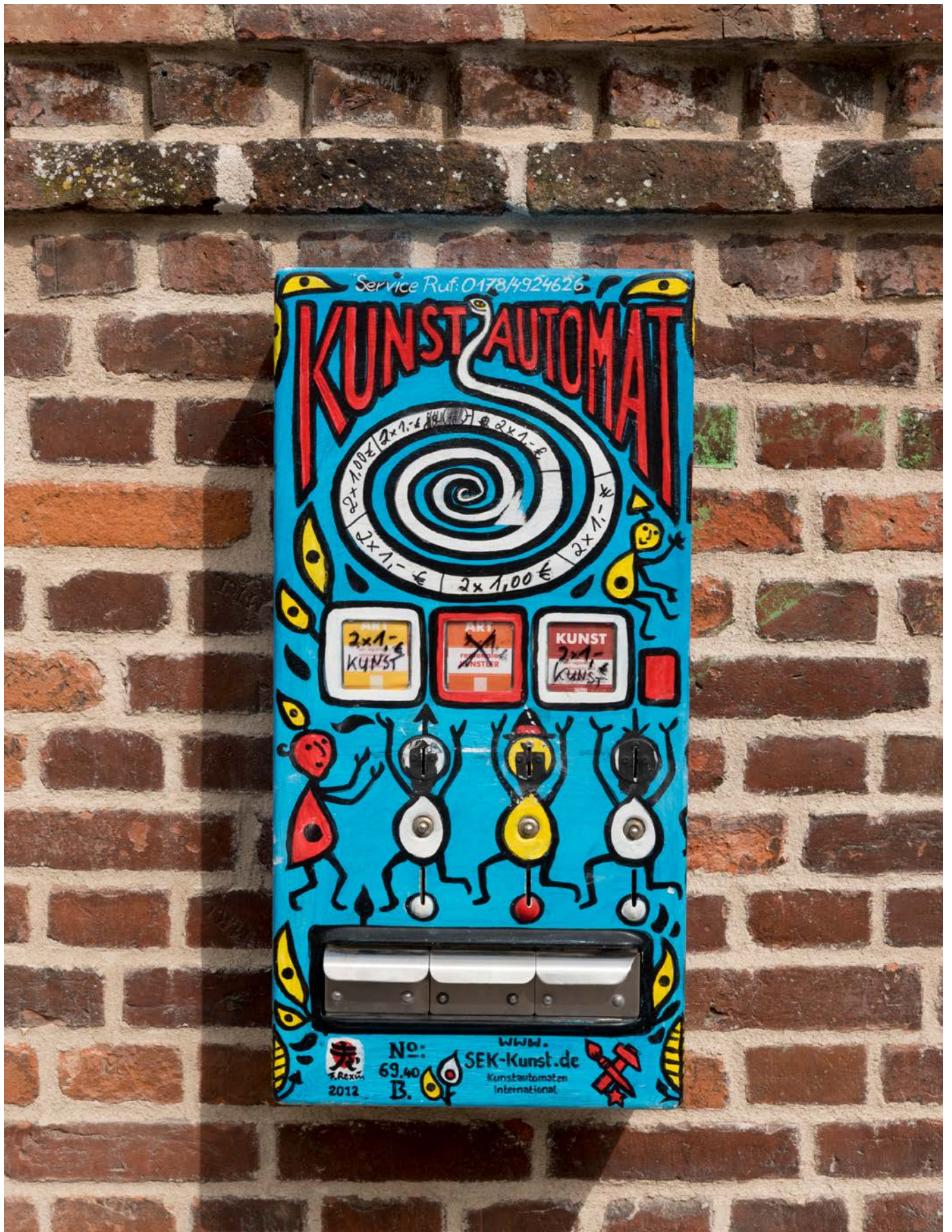
Einer der ca. 250 Kunstautomaten in Deutschland, dieser befindet sich in der Alten Potsdamer Straße in Teltow.