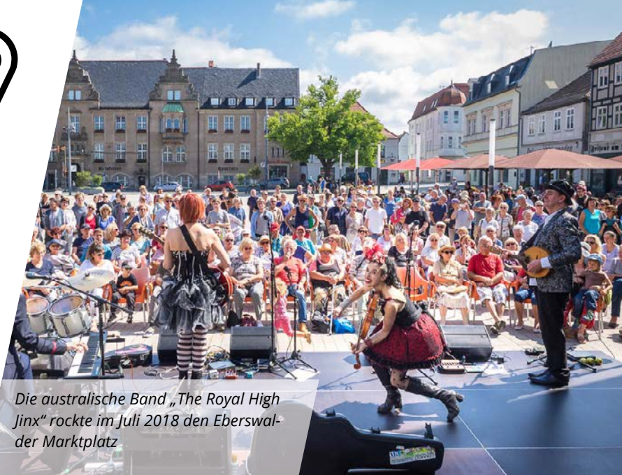
Die australische Band „The Royal High Jinx“ rockte im Juli 2018 den Eberswalder Marktplatz