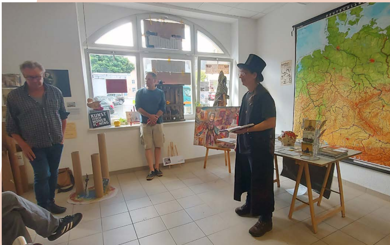
Bespielter Leerstand im temporären Kunstbüro des Kunstvereins Hoher Fläming e. V. in Bad Belzig