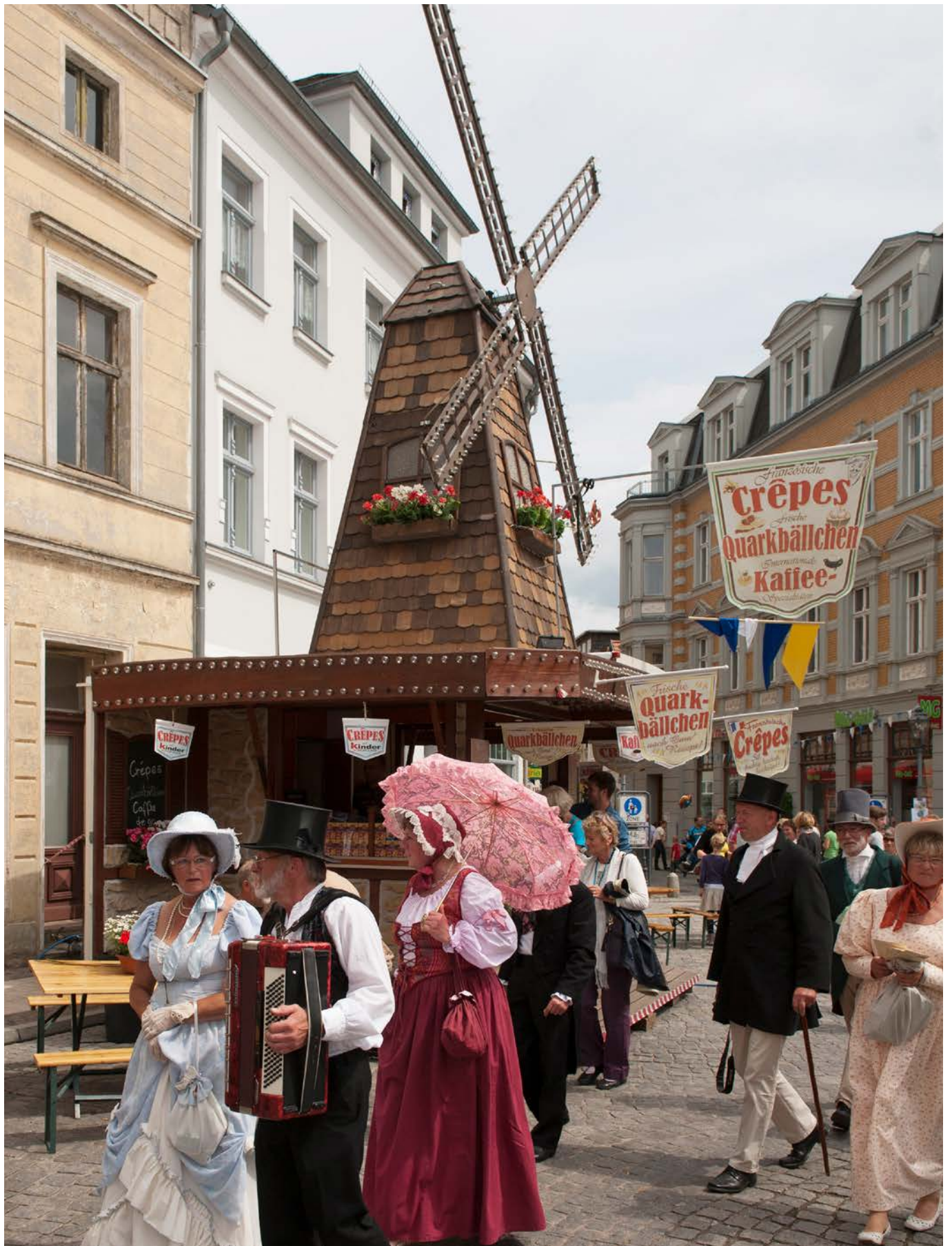
Stadtfest und 775-Jahr-Feier in Perleberg