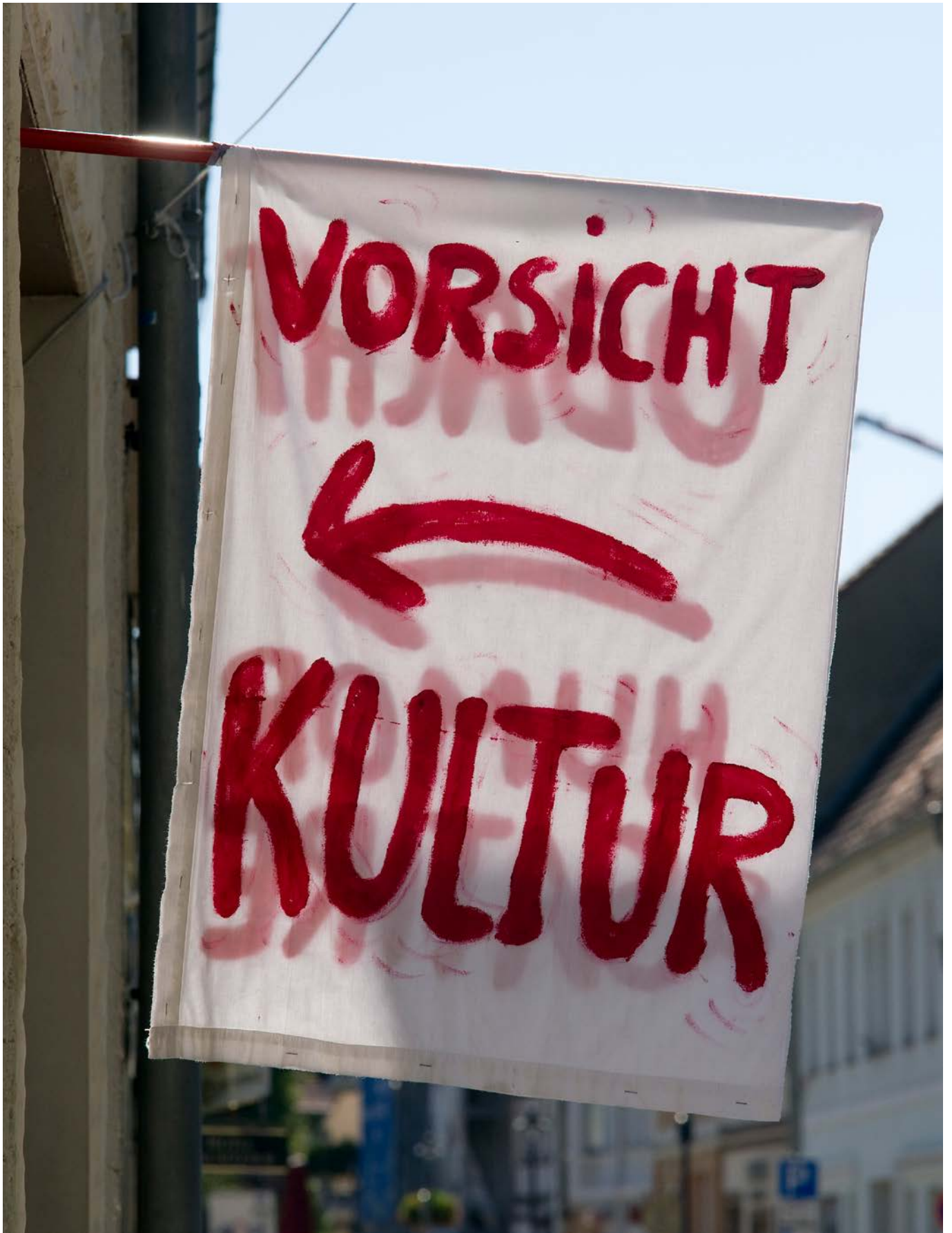
Kultur in der Ehm-Welk-Straße in Lübbenau/Spreewald