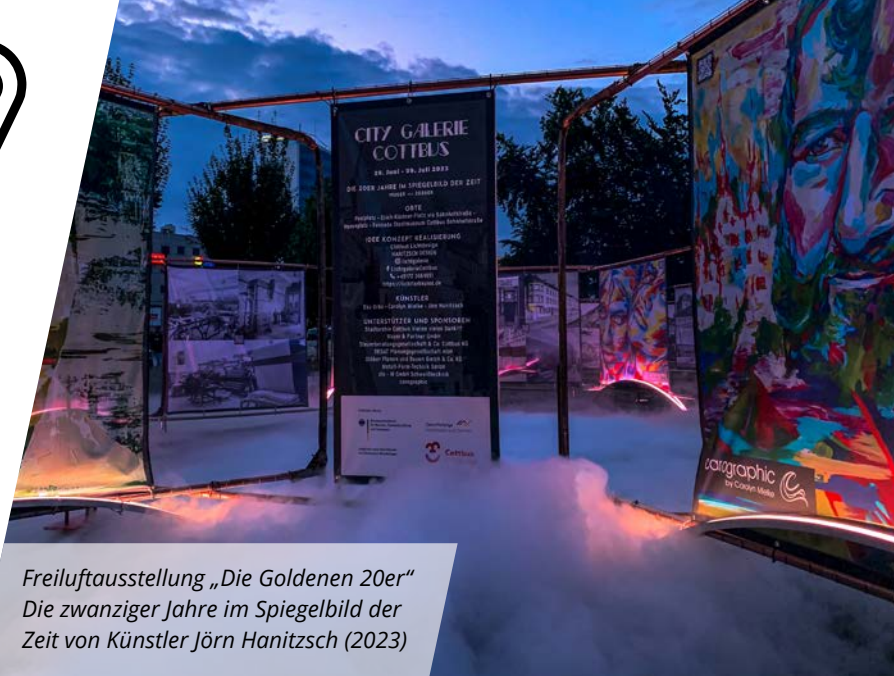
Freiluftausstellung „Die Goldenen 20er“ Die zwanziger Jahre im Spiegelbild der Zeit von Künstler Jörn Hanitzsch (2023)