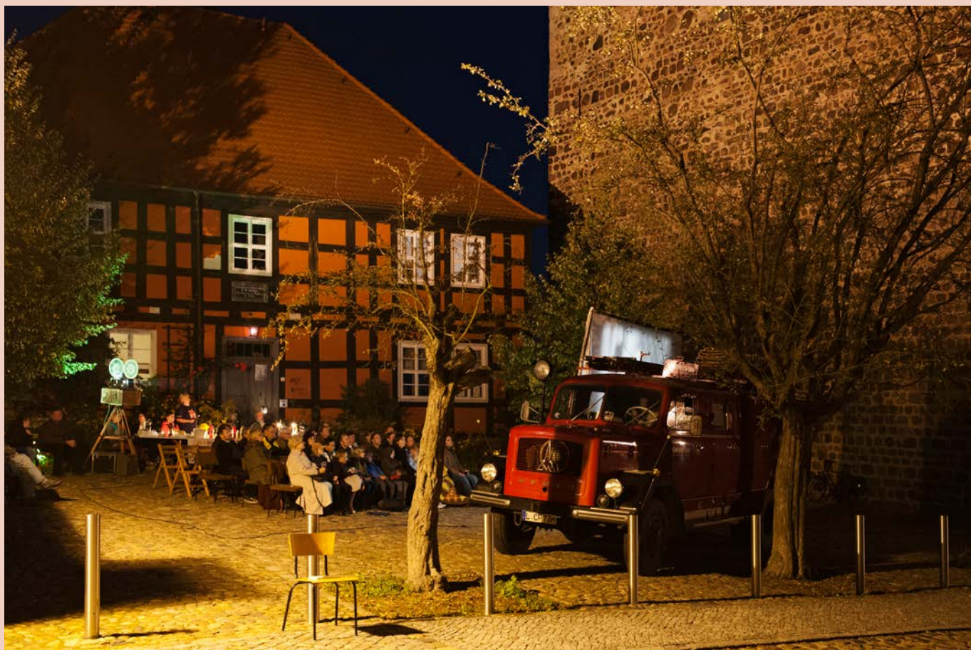
Wanderkino „Laster der Nacht“: Stummfilme mit Live Musikbegleitung in Bad Belzig